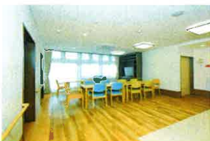
ユニットのリビング