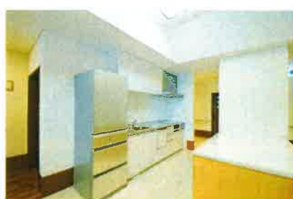
ユニットのキッチン